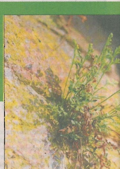
■ Muurvaren bij de Spanjaardspoort.