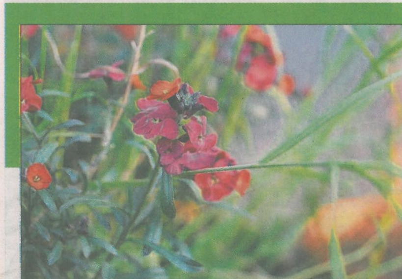
■ Variëteiten van de muurbloem zijn soms in tuinen te vinden.

de vergunning. De muurbloem wil alleen wortelen als tussen de stenen een specie is gebruikt die veel kalk bevat. In het oorspronkelijke land van de Romeinen houdt hij van kalkrijk rotsged. Hij werd noordwaarts meegevoerd als sierplant en vanwege de hem toegedichte geneeskrachtige eigenschappen.