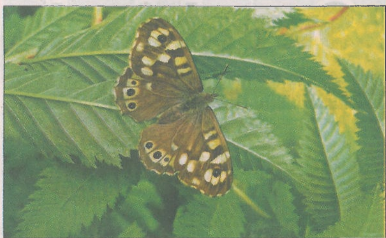
■ Een bont zandoogje geniet in een Luttenbergse tuin van het zonnige voorjaar.

Wat mij betreft, mogen er meer houtrils komen. Al begrijp ik best dat niet elk perceel zich daarvoor leent. Wellicht dat de rommelige aanblik van een houtril mensen ervan weerhoudt er eentje te bouwen. Kamperfoelie of vlierbes eroverheen laten groeien, kan wonderen doen.